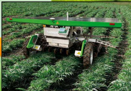
Weeding of alcaloids by robot.