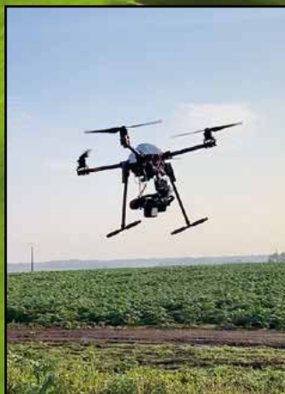
Drone for alcaloids search (contract with THALES Group)